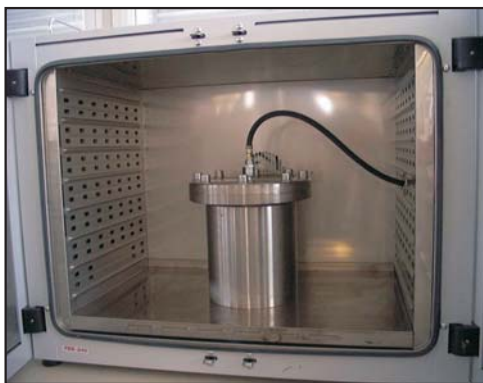
Druckbehälter im Ofen

In diesem nach SHRP-Richtlinien selbstgebauten Druckbehälter werden Bitumenproben künstlich gealtert. Das Bitumen wird 20 Stunden lang einer Temperatur von 100 °C und einem Druck von 2100 kPa (21 bar) ausgesetzt.