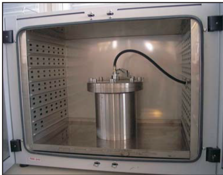
Druckbehälter im Ofen

Im Druckbehälter werden Bitumenproben künstlich gealtert. Das Bitumen wird 20 Stunden lang einer Temperatur von 100 °C und einem Druck von 2100 kPa (21 bar) ausgesetzt.